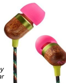
House of Marley Destiny Smile Jamaica™ In-Ear Hörlurar