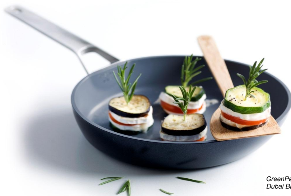
GreenPan™ Dubai Black

Periodens kassaflöde från den löpande verksamheten före förändring av rörelsekapital var 34,2 mkr (-0,1), tack vare försäljningen av aktierna i SodaStream Nordics AB. Förändring i rörelsekapital påverkade kassaflödet positivt med 75,5 mkr (16,5), främst hänförligt till att SodaStream verksamheten har avyttrats. Kassaflödet från investeringsverksamheten var -0,1 mkr (-3,6). Kassaflödet från finansieringsverksamheten var -104,6 mkr (-12,6) beroende på amortering av lån. Periodens kassaflöde uppgick till -30 mkr (0,3).