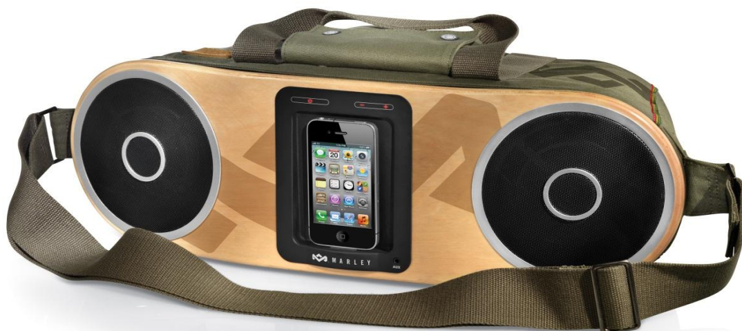
House of Marley Bag of Rhythm Portable Audio System