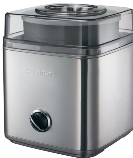
Cuisinart ICE30BCE Glassmaskin