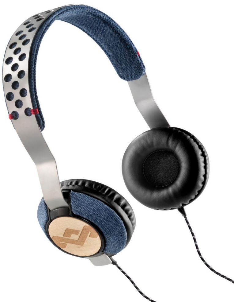
The House of Marley EM-JH073-DN Liberate Denim, On-ear hörlurar