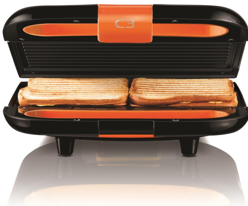
C3 30-10721 Sandwich Maker