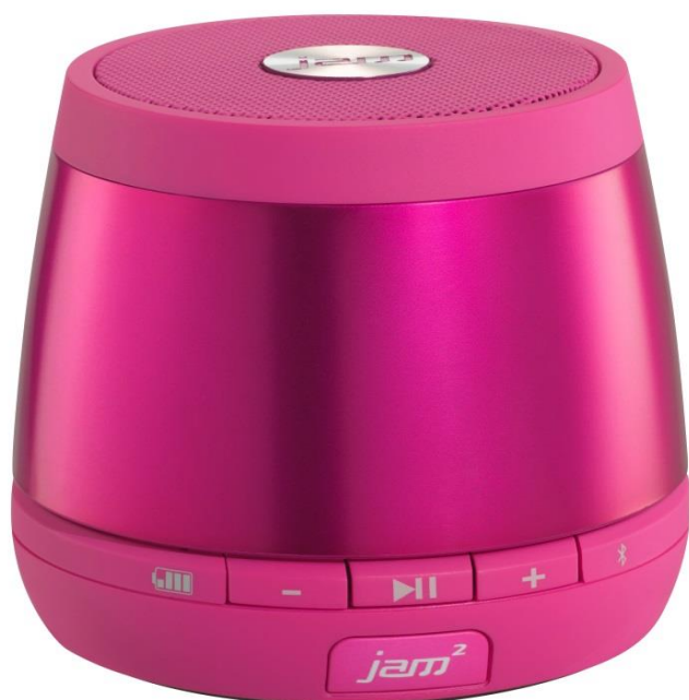
HoMedics HX-P240PK-EU HMDX Jam Plus

Periodens kassaflöde från den löpande verksamheten före förändring av rörelsekapital var -19,3 mkr (-20,3). Förändring i rörelsekapital påverkade kassaflödet positivt med 7,3 mkr (59,6). Kassaflödet från investeringsverksamheten var -14,1 mkr (68,7) och utgörs främst av den utbetalning som gjordes till SodaStream efter den slutgiltiga överenskommelse. Kassaflödet från finansieringsverksamheten var 15,8 mkr (-105,2) främst beroende på upptagna ägarlån under perioden. Periodens kassaflöde uppgick till -10,2 mkr (2,8).