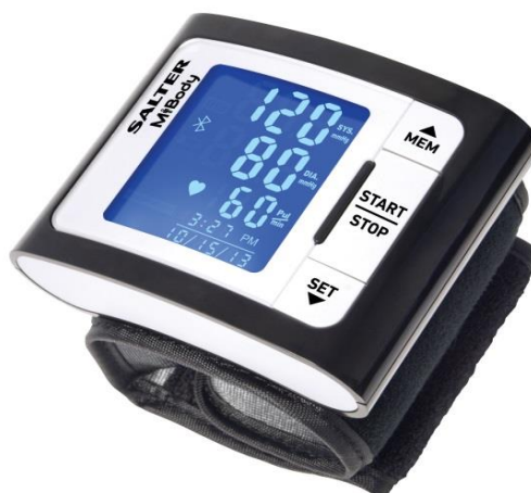
Salter BPW-9154 Blodtrycksmätare MiBody (bluetooth)