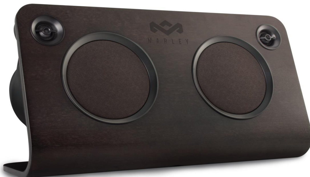
The House of Marley EM-FA001-PT Get Up Stand Up / Bluetooth Audio System