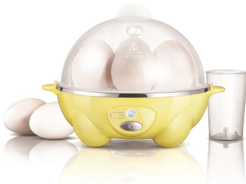
C3 30-10715 Äggkokare EggXpert