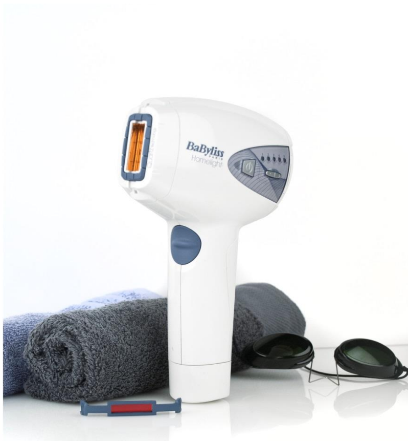
BaByliss G930E HomeLight / Ljusepilator

Periodens kassaflöde från den löpande verksamheten efter förändring av rörelsekapital var 6,0 mkr (-6,3). Kassaflödet från investeringsverksamheten var -0,0 mkr (-9,8). Kassaflödet från finansieringsverksamheten var -5,4 mkr vilket består av återbetalning av lån (5,6). Periodens kassaflöde uppgick till 0,6 mkr (-10,5).