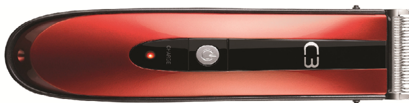
The Mauler Collection - Powertrim